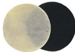
PAD A DISCO PER PULIZIA E LUCIDATURA

Per il ripristino di piccoli danneggiamenti