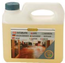
SAPONE NATURALE SAPONE BIANCO