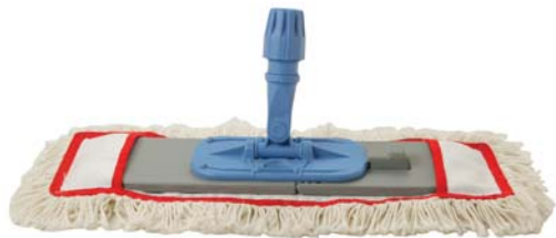
MOCIO CON FIBRE DI COTONE