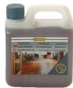
OLIO DI MANTENIMENTO NATURALE BIANCO TINTO